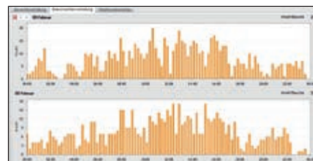
Grafické zobrazení časů návštěv váhy