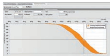
Grafické zobrazení růstového přehledu