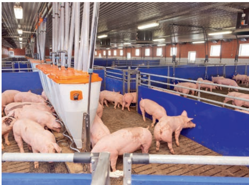
Po nakrmění opouštějí zvířata krmnou oblast jednosměrnou brankou