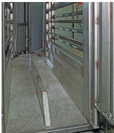
Uvnitř váhy je umístěna protisklizová podlážka