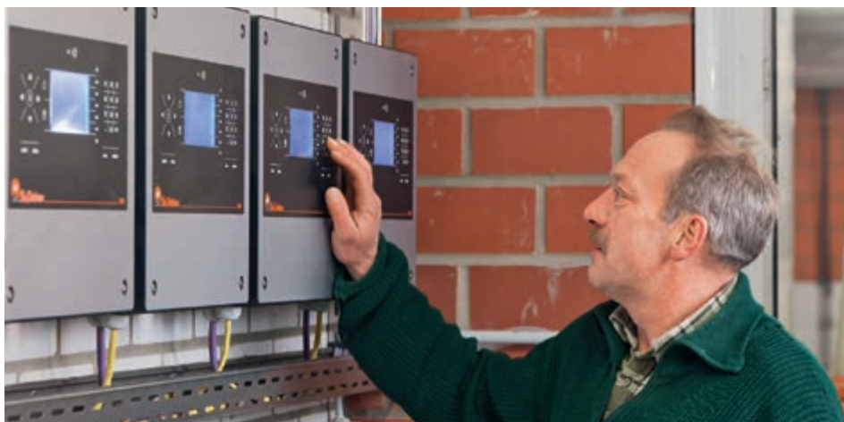
Každá třídící váha TriSort pro je řízena ovladačem, které jsou zde nainstalovány v předprostoru stáje