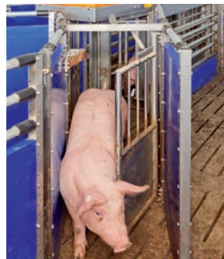
Východ se selekční brankou