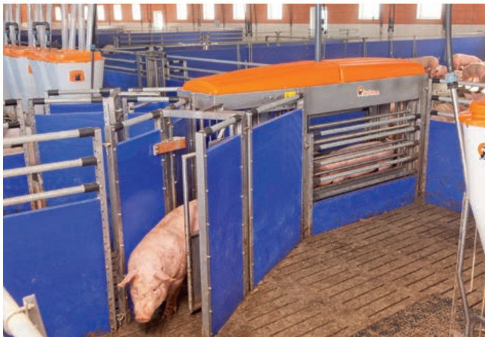
Použití TriSort pro s 2 selekčními východy

Dvojitá a velmi stabilní vstupní branka je za prázdného stavu vždy otevřená. Jakmile vstoupí zvíře na váhu, zaznamenaná váha změnu hmotnosti a vstupní branka se automaticky uzavře. Díky tomu může na váhu vstoupit vždy jen jedno zvíře. Oblast vážení je vybavena protisklizovou podlahou. Po ukončení vážení, které trvá cca dvě až tři vteřiny, se automaticky otevře výstupní branka. Následná selekční branka pak rozhoduje, do které krmné oblasti má zvíře pokračovat nebo zda má být krátce před termínem porážky vyříděno jako jatečně zralé. Vstupní, výstupní i selekční branka se otevírá i zavírá pneumaticky.